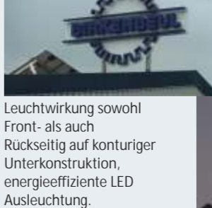
Leuchtwirkung sowohl Front- als auch Rückseitig auf konturiger Unterkonstruktion, energieeffiziente LED Ausleuchtung.