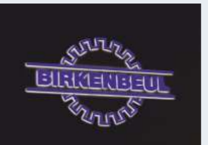
Front und Rückseitenleuchter mit LED