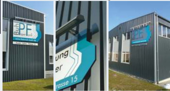
Fassadenschilder mit aufgesetztem Lichtkanal angestrahlt